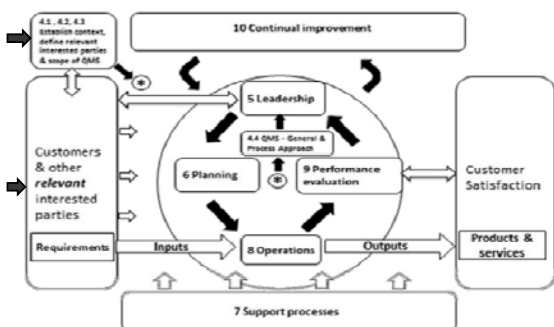
Figure 1 - Model of a process-based quality management system, showing the links to the clauses of this International Standard